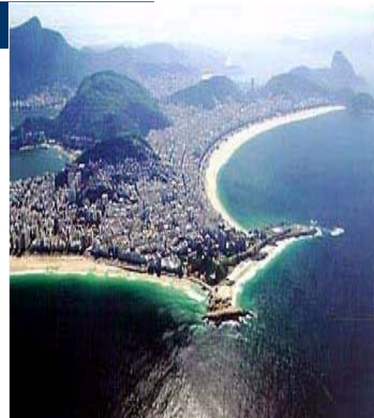
Ipanema, Arpoador e Copacabana