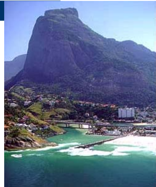
Pedra da Gávea