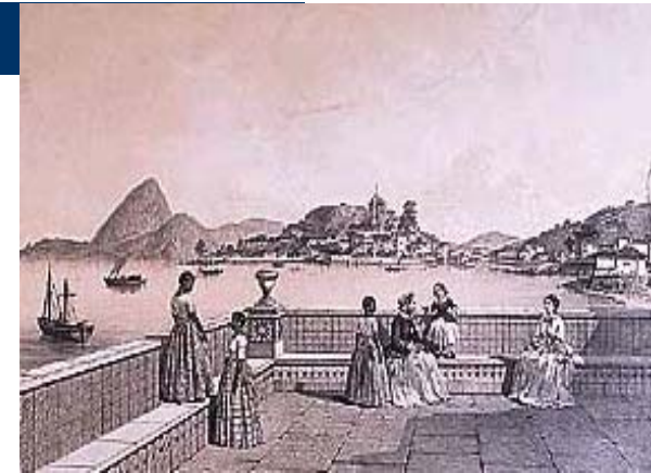
Baía de Guanabara